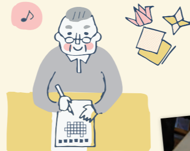
【レクリエーション】