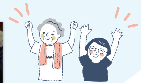
【レクリエーション】