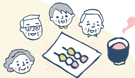
【おやつ・コーヒータイム】