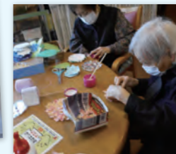
—レクリエーションの様子—