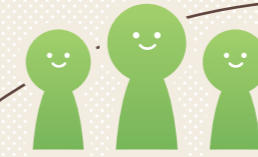
利用者さん・ご家族

万が一、病気や怪我の後遺症等で状態が悪くても... 看護小規模多機能型居宅介護 あったかホームさくら